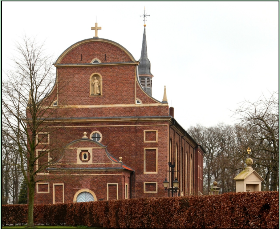
Zwillbrock, Barockkirche St. Franziskus

Bei dieser Tour handelt es sich um eine Sterntour. Wir werden von Emsdetten nach Vreden radeln um dort das niederländische Grenzgebiet und das Zwillbrocker Venn erkunden.