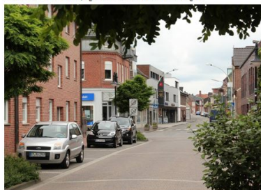
217. Ein völlig anderes Bild bietet sich im Juni 2013: Ein Großteil der alten Bebauung ist abgerissen und Neubauten sind an deren Stelle getreten.