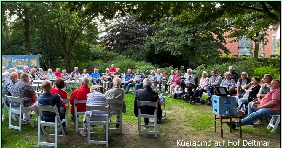
Küeraomd auf Hof Deitmar

Seit 2018 findet am Buß- und Betttag die plattdeutsche Andacht - nur einmal unterbrochen von Corona - statt. Auch für den 20. November 2024 (Buß- und Betttag) ist wieder eine plattdeutsche Andacht in der Gustav-Adolf-Kirche geplant. Nähere Informationen finden Sie in der Emsdettener Volkszeitung