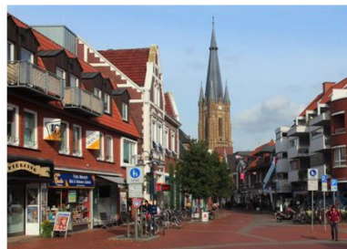
296. Derselbe Standpunkt etwa hundert Jahre später am 10. Oktober 2012.