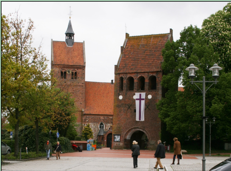
Bad Zwischenahn, Johanneskirche

Westerstede mit Deutschlands größtem Rhododendronpark und Bad Zwischenahn mit einer Schifffahrt und Mittagessen auf dem Bad Zwischenahner Meer.