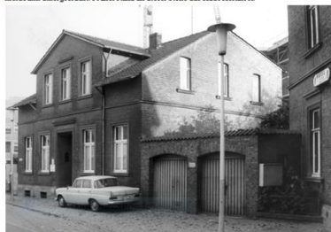
131. Haus Bolefahr.