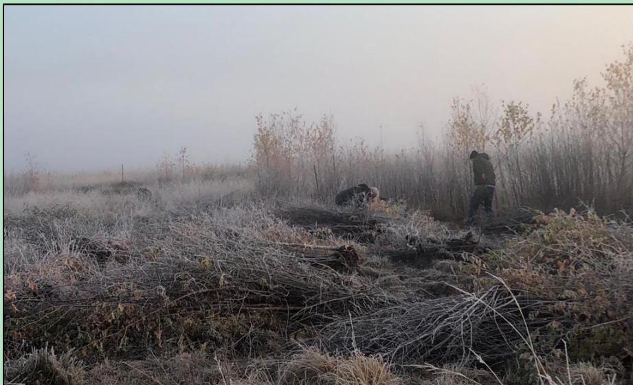
Einsatz im Emsdettener Venn

Gegründet wurde die Natur- und Umweltschutzgruppe des Heimatbundes am 21. April 1980. Im Mittelpunkt der Arbeiten, die im Herbst und Winter durchgeführt werden, steht die Pflege des 320 Hektar umfassenden Emsdettener Venns. Als klassischem Hochmoor droht ihm sonst die Verbuschung durch die sich rasch ausbreitenden und ständig nachwachsenden Birken und Faulbäume. Diese entziehen dem Moor das Wasser und zerstören es so allmählich. Gruppensprecher der Vienndüwels ist Ludger Lehmkuhl.