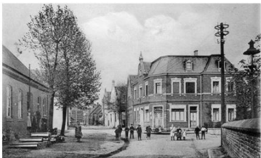
372. Dieses Bild zeigt einen Blick auf das Haus Wähningum 1912. In dem Gebäude war Jahre lang ein Kolonialwarengeschäft untergebracht. Hinter der Mauer rechts zweigt die Bachstraße in Richtung Krankenhaus ab. Links liegt die Holzhandlung Borgers.