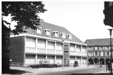
130. Im Jahr 1965 zog die Dresdner Bank in den Neubau am Brink um. Heute ist hier die Commerzbank untergebracht. Früher stand an dieser Stelle das Haus Kerschhoff.