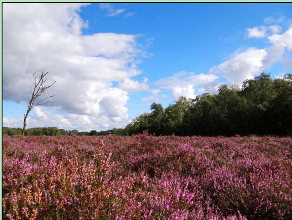
Heideblüte im Emsdettener Venn