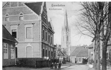
295. Die Besitzung Wemmen - hier links im Bild - kam durch Heirat an Clemens Mersch, der in diesem Haus im Jahr 1902 eine Schmiede eröffnete.