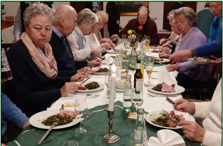
Moosessen am 18. November 2023 im Deutschen Haus in Reckenfeld