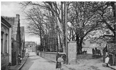
371. Die Mühlenstraße („Müllendamm“) – eine der ältesten Straßen Emsdettens – um das Jahr 1920. Links die Häuser Löbbel, Schmitz, Kattmeißel und Alken, rechts die Einfahrt zu Detmars Hof. 1877 wurde die Pflasterung der Straße für 750 Mark mit der Auflage genehmigt, dass die Interessenten die später notwendigen Mittel selber aufbrachten.