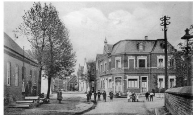
372. Dieses Bild zeigt einen Blick auf das Haus Wähning um 1912. In dem Gebäude war Jahre lang ein Kolonialwarengeschäft untergebracht. Hinter der Mauer rechts zweigt die Bachstraße in Richtung Krankenhaus ab. Links liegt die Holzhandlung Borgers.