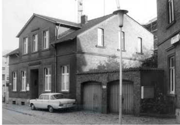
131. Haus Bötelfahr.