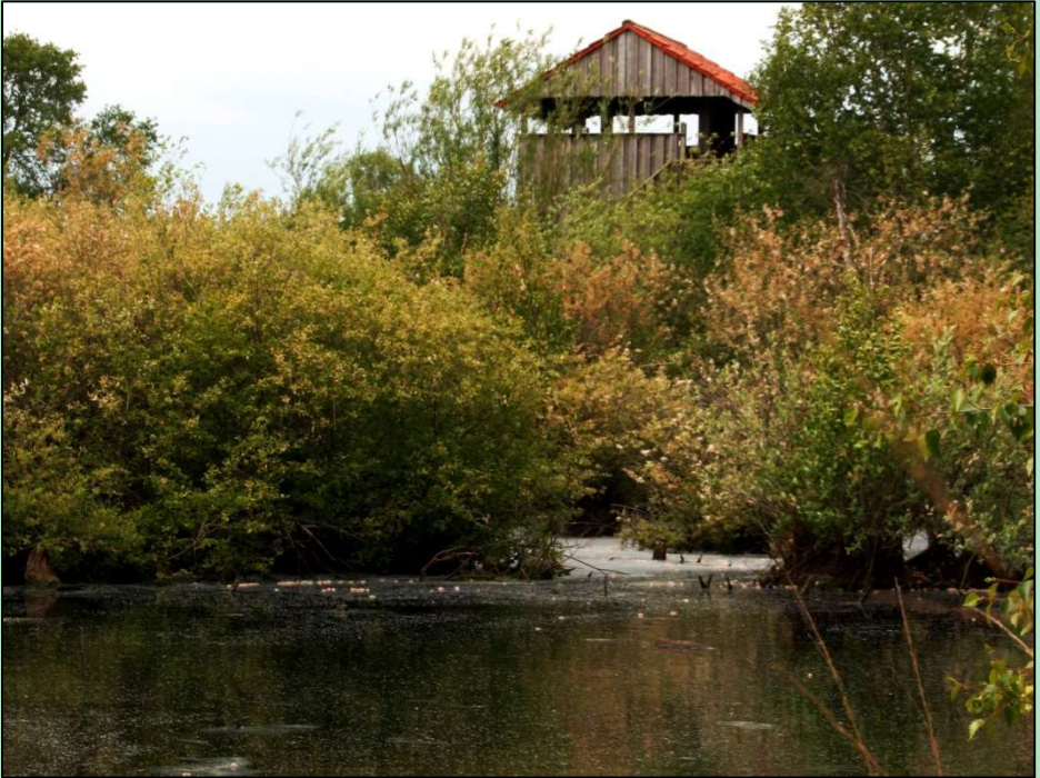
Aussichtsturm im Venn

Bitte unterstützen Sie die ehrenamtlichen Aufgaben des Heimatbundes und werden Sie Mitglied.