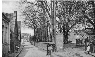
371. Die Mühlenstraße („Müllenkamp“) – eine der ältesten Straßen Emsdettens – um das Jahr 1920. Links die Häuser Löbbel, Schmitz, Kattenbock und Altes, rechts die Einfahrt zu Detmars Hof. 1877 wurde die Pflasterung der Straße für 750 Mark mit der Auflage genehmigt, dass die Interessenten die später notwendigen Mittel selber aufbrachten.