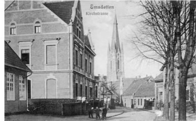
295. Die Bestattung Wemmers - hier links im Bild - kam durch Heirat an Clemens Mersch, der in diesem Haus im Jahr 1902 eine Schmiede eröffnete.