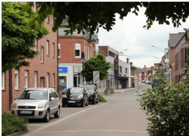
217. Ein völlig anderes Bild bietet sich im Juni 2013: Ein Großteil der alten Bebauung ist abgerissen und Neubauten sind an deren Stelle getreten.