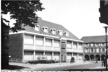
130. Im Jahr 1965 zog die Dresdner Bank in den Neubau am Brink um. Heute ist hier die Commerzbank untergebracht. Früher stand an dieser Stelle das Haus Kerschhoff.