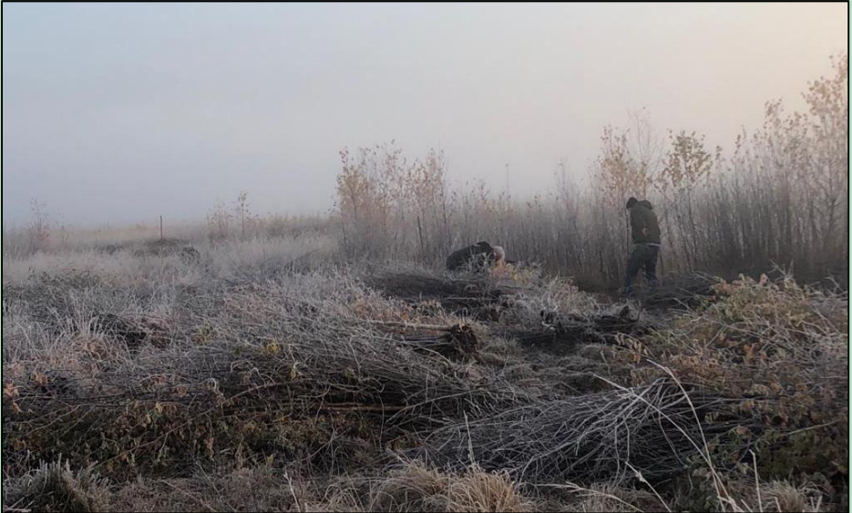
Einsatz im Emsdettener Venn

Gegründet wurde die Natur- und Umweltschutzgruppe des Heimatbundes am 21. April 1980. Im Mittelpunkt der Arbeiten, die im Herbst und Winter durchgeführt werden, steht die Pflege des 320 Hektar umfassenden Emsdettener Venns. Als klassischem Hochmoor droht ihm sonst die Verbuschung durch die sich rasch ausbreitenden und ständig nachwachsenden Birken und Faulbäume. Diese entziehen dem Moor das Wasser und zerstören es so allmählich. Gruppensprecher der Vienndüwels ist Ludger Lehmkuhl.