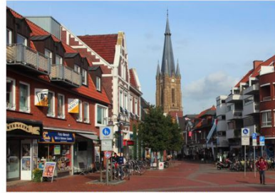
296. Derselbe Standpunkt etwa hundert Jahre später am 10. Oktober 2012.